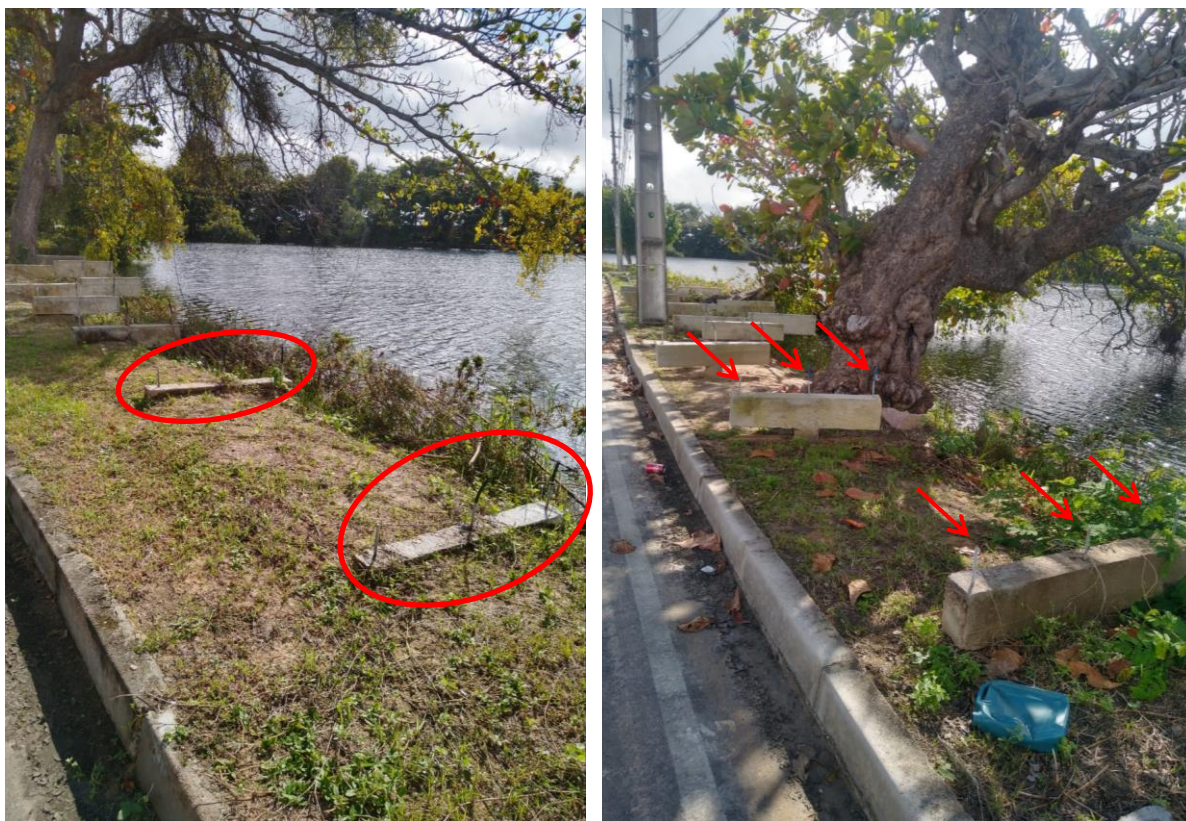
Anexo V – Durante todo o trecho da área da Orla é possível identificar diversas pontos com “esperas” de vergalhões, sem qualquer tipo de proteção para evitar acidentes - Orla do Capuxú.

Além disso, foi possível notar também que trechos de meio fio já estão danificados, o que comprova o estado de abandono e falta de cuidado do poder público, relatado por diversos munícipes e demonstrados a seguir.