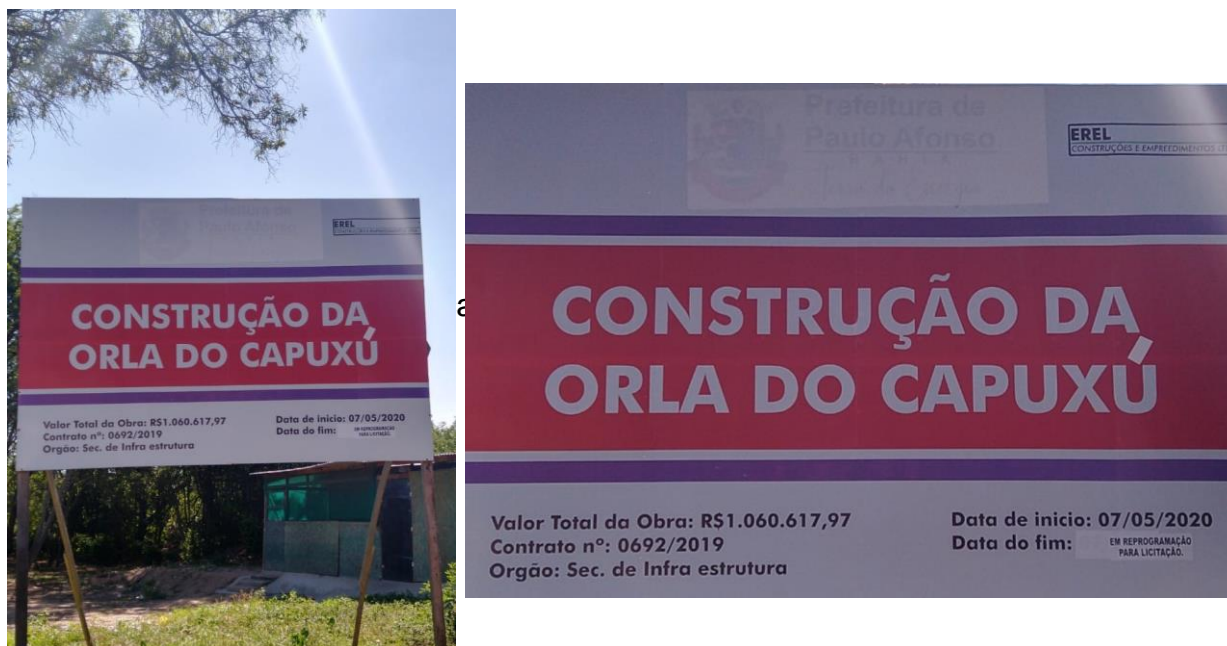
Anexo VII – Em destaque: placa indicativa com modificações – Orla do Capuxú.

Outro fato que chamou atenção durante a visita está relacionado à substituição da placa indicativa: durante os anos de 2020 e 2021 a placa original era exposta normalmente, posteriormente, constatado o atraso na entrega deste espaço houve algumas modificações: sendo encobertos a identificação da PMPA e a data de conclusão, conforme a fotografia a seguir: