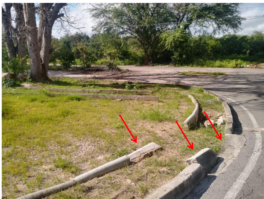
Anexo VI – Em destaque: trecho de meio fio parcialmente danificado.

Além disso, foi possível notar também que trechos de meio fio já estão danificados, o que comprova o estado de abandono e falta de cuidado do poder público, relatado por diversos munícipes e demonstrados a seguir.