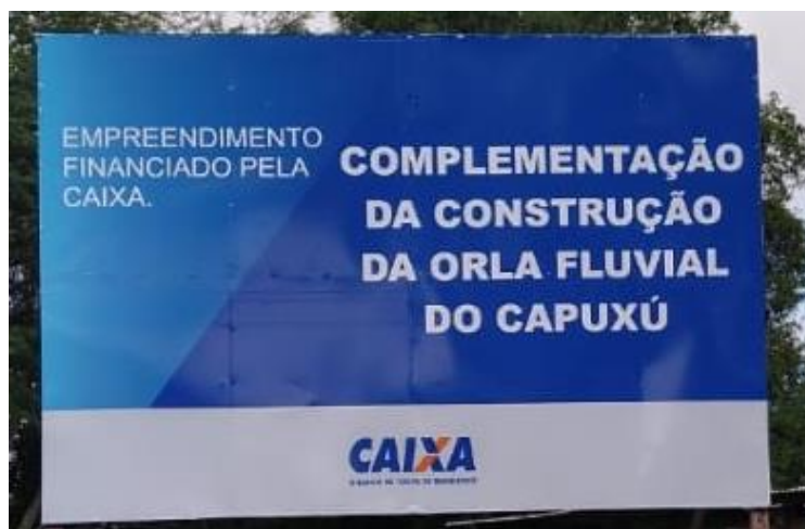
Anexo VIII – Nova placa fixada nos arredores da Orla do Capuxú.

Atualmente a placa foi substituída, não sendo mais exibidas quaisquer informações referentes a datas, valores ou empresas, apenas informa da “complementação da construção da orla”, mesmo sem a realização de qualquer atividade construtiva no local, conforme o anexo seguinte.