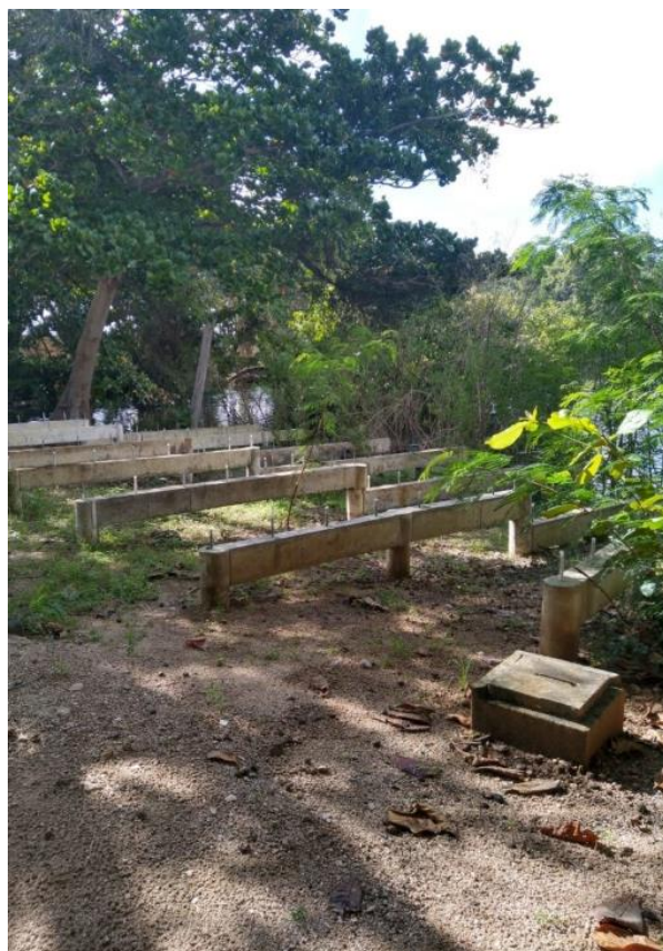
Anexo II – Parte da estrutura que receberá o deck em madeira: parcialmente tomada pela vegetação – Orla do Capuxú.