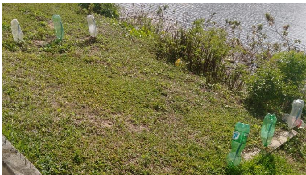
Anexo IV – Moradores da Rua Bela Vista improvisam alertas para evitar incidentes ao longo da Orla do Capuxú.

Outro fato que chamou atenção: a ausência de medidas de segurança que busquem alertar transeuntes (cidadãos e turistas) que ainda frequentam a localidade, a fim de preservá-los dos riscos iminentes de acidentes. Nas áreas mais próximas às residências, por exemplo, alguns moradores tomaram a iniciativa de fixar garrafas PET's , tentando alertar para a existência dos vergalhões expostos, mostradas nas fotografias a seguir.