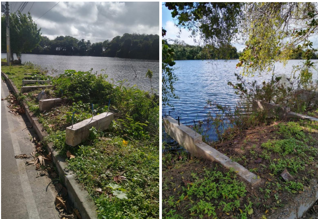
Anexo III – Parte da estrutura do deck parcialmente tomada pela vegetação – Orla do Capuxú.

Outro fato que chamou atenção: a ausência de medidas de segurança que busquem alertar transeuntes (cidadãos e turistas) que ainda frequentam a localidade, a fim de preservá-los dos riscos iminentes de acidentes. Nas áreas mais próximas às residências, por exemplo, alguns moradores tomaram a iniciativa de fixar garrafas PET's , tentando alertar para a existência dos vergalhões expostos, mostradas nas fotografias a seguir.