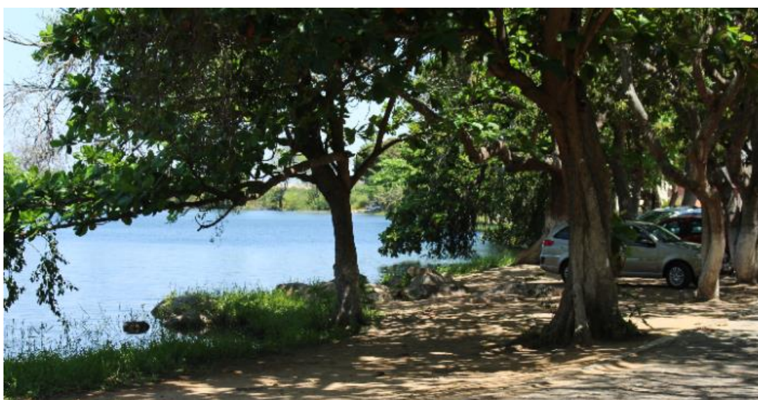
Foto 01 – Orla do Capuxú, ano de 2018.

Em agosto de 2018, a Prefeitura de Paulo Afonso (PMPA) apresentou à comunidade o projeto de revitalização de dois espaços: a orla do Lago do Capuxú e a orla do Lago da Aurora – que abordamos anteriormente em outro relatório. Idealizadas pela Secretaria de Turismo, Indústria e Comércio sob responsabilidade de desenvolvimento da Secretaria de Infraestrutura, estas intervenções fariam parte de um projeto de reurbanização do Balneário e outros pontos turísticos adjacentes.