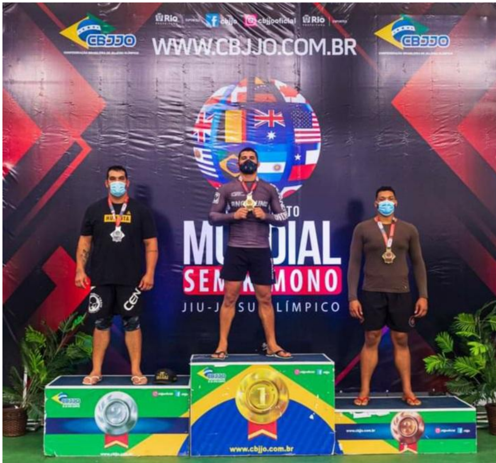
Figura 18: Campeonato Mundial de Jiu-Jitsu sem kimono (no-gi), Rio de Janeiro/RJ (2021)

Em junho de 2021, lutei o Campeonato Mundial de Jiu-Jitsu sem kimono (no-gi), no Parque Olímpico do Rio de Janeiro/RJ, ficando em terceiro colocado.