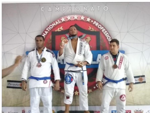
Figura 5: Campeão do Grand Slam (2018)

Ainda em 2018, disputei o Grand Slam Internacional, sediado em Salvador/BA, conquistando o lugar mais alto do pódio.