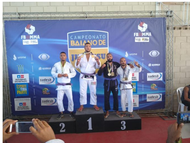
Figura 9: Campeonato Baiano de Jiu-Jitsu, em Cruz das Almas (2019)

Em julho do mesmo ano, volto a ser campeão baiano, obtendo ouro quádruplo, sendo vencedor peso por peso e absoluto peso livre, nas modalidades com e sem kimono (gi e no-gi).