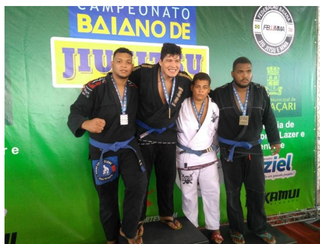
Figura 4: Medalha de prata no Campeonato Baiano de Jiu-Jitsu em Camaçari/BA (2018)

No mesmo ano, participei de mais uma etapa do Campeonato Baiano de Jiu-Jitsu, sediado dessa vez, na cidade de Camaçari/BA, obtendo medalha de prata.