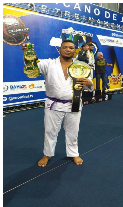
Figura 8: Campeonato Brasileiro de Jiu Jitsu (2019)

Em junho/19, conquistei a categoria peso por peso e o absoluto peso livre, no Campeonato Brasileiro de Jiu-Jitsu, com e sem kimono (gi e no-gi), ganhando, na mesma competição, três medalhas de ouro e um cinturão de campeão absoluto.