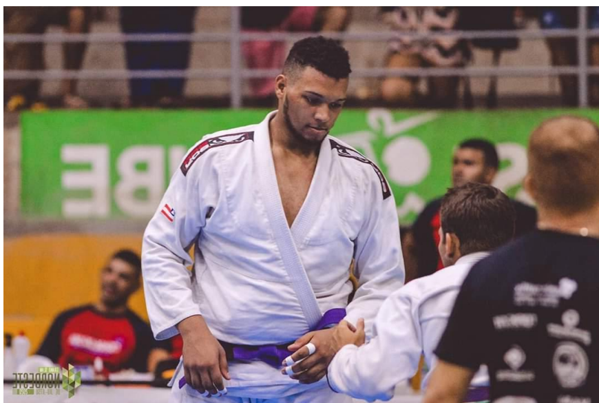
Figura 12: Grand Slam em Natal/RN (2020)

Em março do mesmo ano, participei do campeonato Open Pro BJJ, em Caruaru/PE, sendo campeão na categoria peso por peso e medalha de bronze no absoluto peso livre.