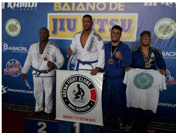
Figura 3: Medalha de ouro no Campeonato Baiano de Jiu-Jitsu (2018)

Em 2018, já graduado faixa azul, retornei às competições, fazendo minha reestreia no Campeonato Baiano daquele ano, no qual consegui me sagrar campeão.