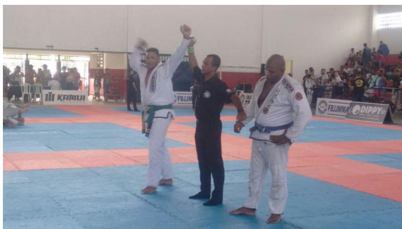
Figura 2: Campeão baiano de jiu-jitsu (2018)

No fim do mesmo ano, por falta de apoio e patrocínio, fui forçado a abandonar as competições. Meses depois, sofri uma lesão no ombro direito, o que me deixou fora dos campeonatos durante todo ano de 2017.