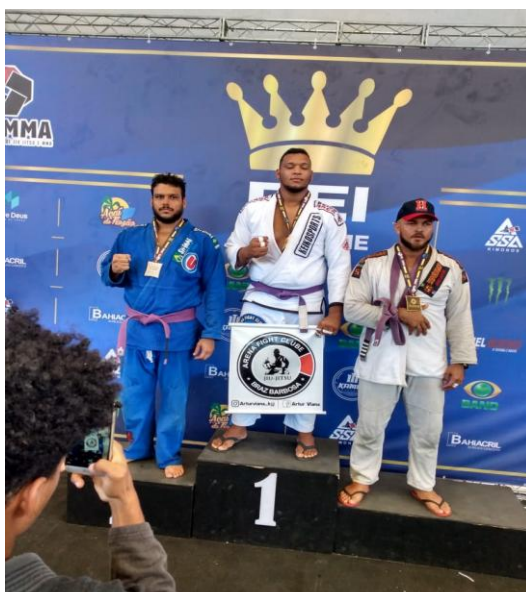
Figura 6: Campeão Rei do Tatame (2019)

No ano seguinte, já graduado faixa roxa, estreei no campeonato Rei do Tatame, em Madre de Deus/BA, auferindo a medalha de ouro.