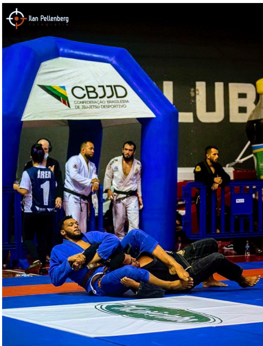
Figura 17: Campeonato Brasileiro da Federação de Jiu-Jitsu Desportivo do Rio de Janeiro (2021)