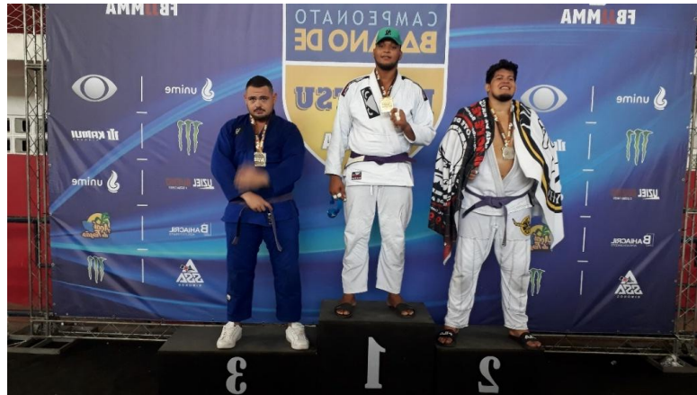
Figura 7: Tricampeão Baiano de Jiu-Jitsu (2019)

Ainda em 2019, me sagrei campeão do Campeonato Baiano de Jiu-Jitsu em Salvador/BA.