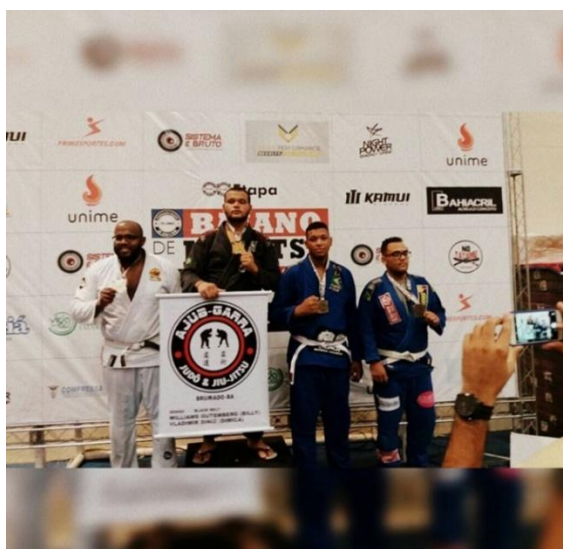
Figura 1: Terceiro colocado do Campeonato Baiano de Jiu Jitsu (2016)

No fim do mesmo ano, por falta de apoio e patrocínio, fui forçado a abandonar as competições. Meses depois, sofri uma lesão no ombro direito, o que me deixou fora dos campeonatos durante todo ano de 2017.