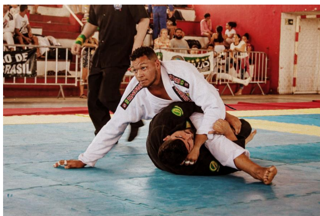
Figura 10: Campeonato Brasileiro – Região Nordeste de Jiu-Jitsu (2019)

No mês seguinte, através da realização de rifas e obtendo ajuda, consegui disputar o Campeonato Brasileiro – Região Nordeste de Jiu-Jitsu, sediado em João Pessoa/PB, sagrando-me campeão na categoria peso por peso e vice campeão absoluto peso livre.