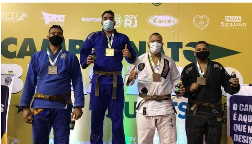
Figura 16: Campeonato Brasileiro da Federação de Jiu-Jitsu Desportivo do Rio de Janeiro (2021)

No mesmo mês, disputei o Campeonato Brasileiro da Federação Desportiva do Rio de Janeiro/RJ, conquistando o vice campeonato.