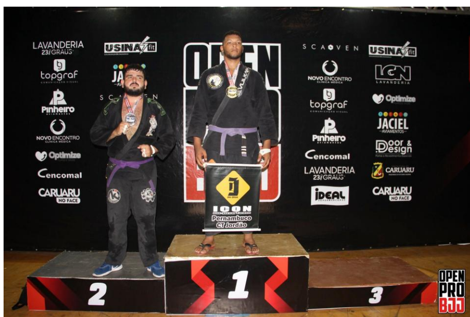
Figura 13: Campeão Open Pro BJJ (2020)

Em março do mesmo ano, participei do campeonato Open Pro BJJ, em Caruaru/PE, sendo campeão na categoria peso por peso e medalha de bronze no absoluto peso livre.