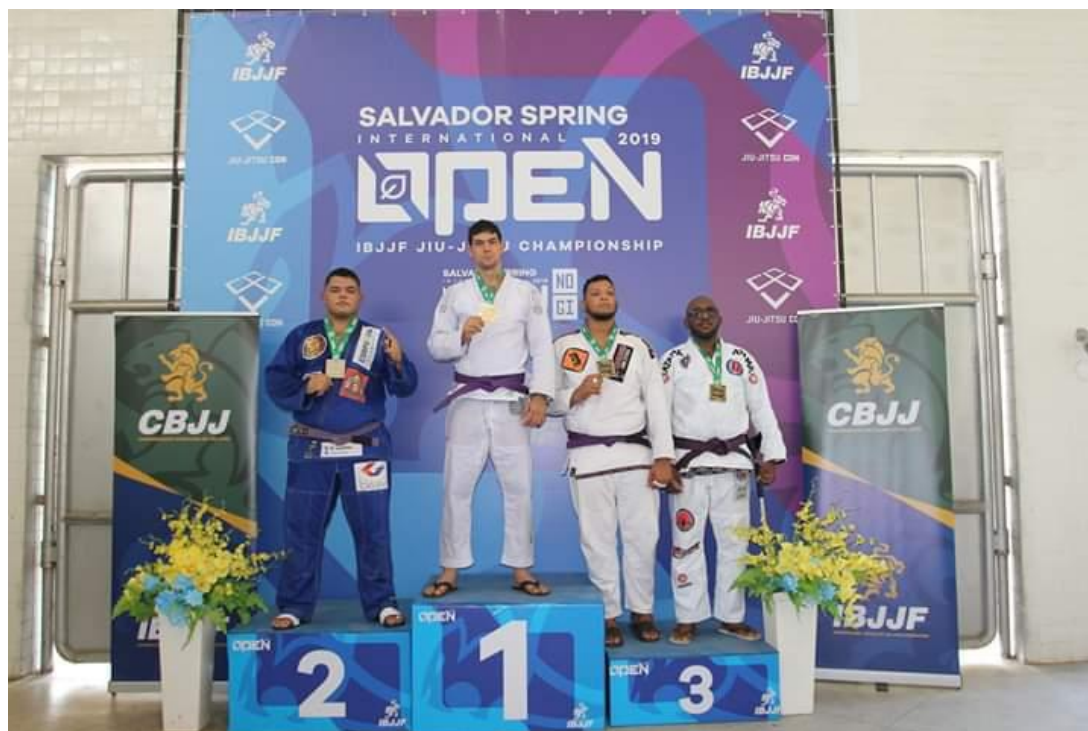
Figura 11: Salvador Spring Internacional Open (2019)

E após participar de mais alguns eventos menores, disputei o Salvador Spring Internacional Open, da IBJJF, maior federação de jiu-jitsu do mundo.