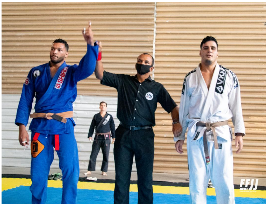
Figura 14: King of Kings, Salvador/BA (2021)

Após a pausa das competições, no ano de 2020, em decorrência da pandemia causada pelo Covid-19, retornei as arenas de competição em fevereiro de 2021, no campeonato King of Kings, em Salvador/BA. Sagrei-me campeão na categoria peso por peso e vice campeão absoluto peso livre.