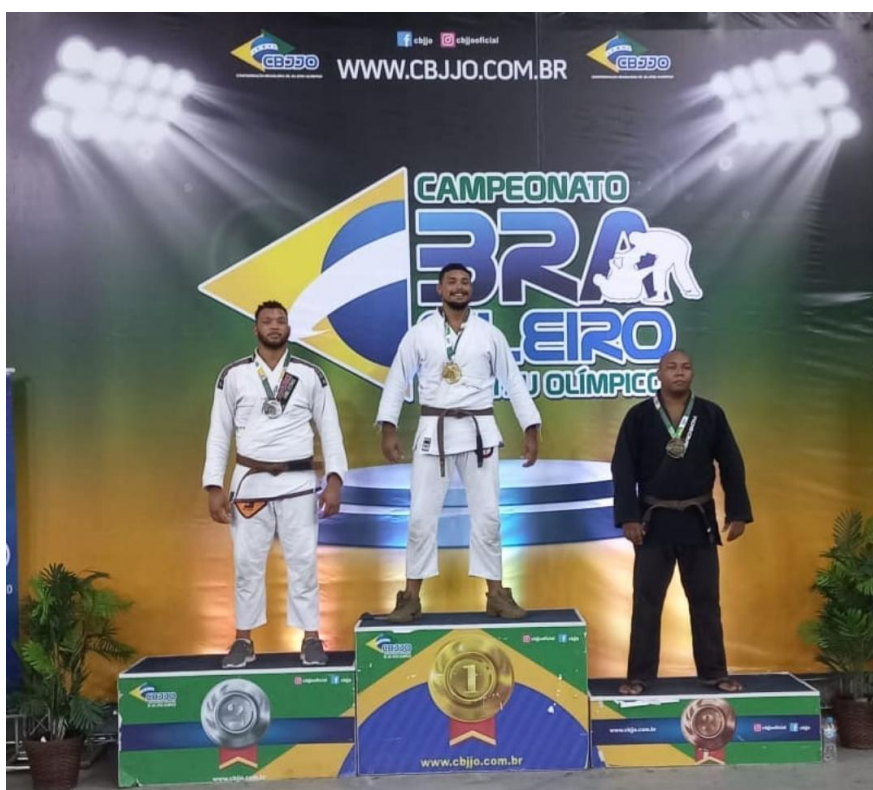
Figura 15: Campeonato Brasileiro. Rio de Janeiro/RJ (2021)

No mesmo mês, disputei o Campeonato Brasileiro da Federação Desportiva do Rio de Janeiro/RJ, conquistando o vice campeonato.